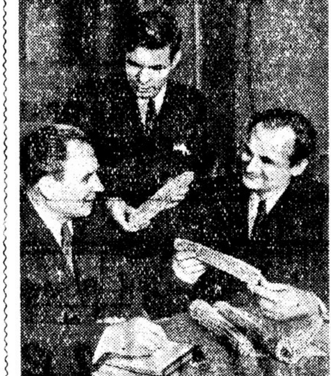
Много ископаных отплынувших на призы ЦК КПСС и Совета Министров СССР об укреплении колхозов руководящими кадрами...

Экспертиза вновь собирается с силами и выносит на сей раз решение примерно такого содержания: «Поскольку автор лживо обвиняется против него самого...»