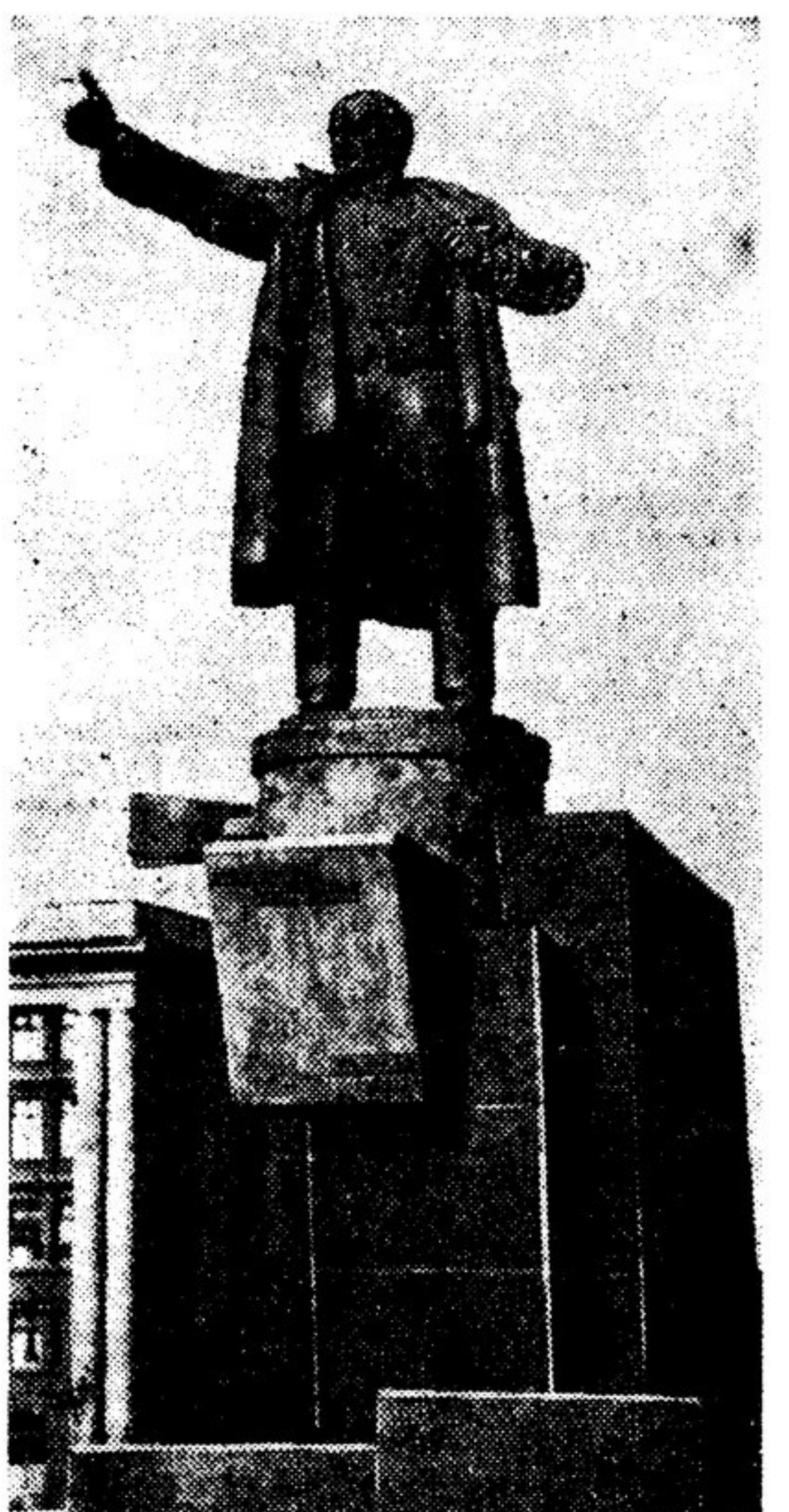
Памятник В. И. Ленину на площади у Финляндского вокзала в Ленинграде.