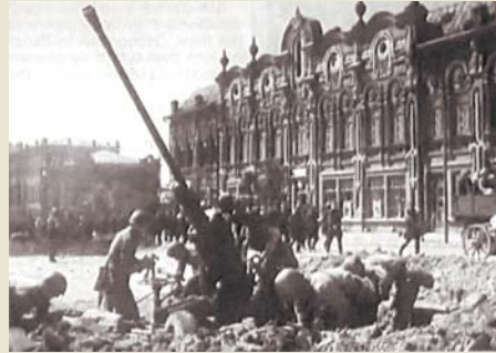
Учебный корпус СГПИ. Осень 1942 г. (слева). Весна 1943 (справа).

В связи с тем, что в разрушенном Сталинграде сложно было найти пригодное для работы здание, исполком Сталинградского областного Совета депутатов трудящихся и областной комитет ВКП(б) решили временно разместить институт в Камышине. Под учебный корпус СГПИ было предоставлено здание райкома партии площадью в 400 м 2 , общежития из 24 комнат, а преподавателям — 15 квартир. Областной совет выделил институту стекло, кухонную и столовую посуду и хозяйственный инвентарь. 15 ноября 1943 г. институт возобновил свою деятельность в составе факультетов: исторического, русского язы-