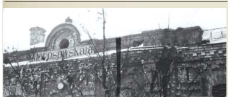
Ж/д вокзал (декабрь 1942 г.)