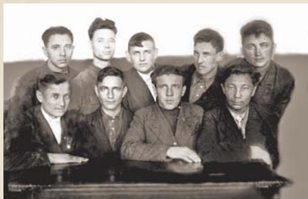
Выпускники исторического отделения учительского СГПИ 1941 г., ушедшие на фронт

Из студентов и преподавателей института создавались отряды для сооружения оборонительных рубежей вокруг города. 635 человек было отправлено в Калачевский район: рыли ходы сообщения, строили противотанковые рвы, пулеметные и минометные гнезда, эскарпы и надолбы. На строительстве оборонительных сооружений студенты ра-