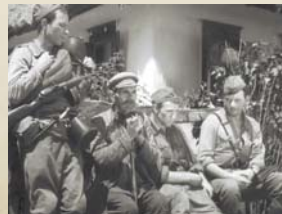
Кадр из фильма «Солдаты» (1956)