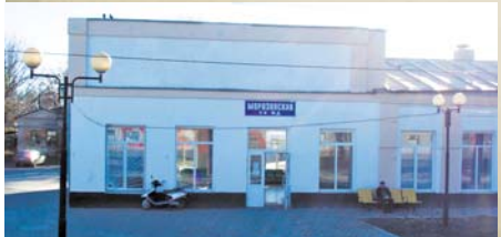
Станция Морозовская, сентябрь 2017 г.

О «Красном Октябре» в повести В.Некрасова упоминается около двадцати раз. За тем, как «стальное сердце» города «допьян и с воздуха и с земли», Юрий Керженцев и его батальон с болью наблюдают из окопов рядом с «Метизным»: «мы смотрим, высунув головы из щелей. Только щепки летят. А щепки – это десятитонные балки, фермы, станики, машины, котлы». В повести упоминается и о периоде завершения сталинградских боёв. Один из сослуживцев пишет раненому Керженцеву в госпиталь: «А 39-ая молодцом. «Красный Октябрь» почти полностью очистила». После окончания боёв в «сердце» Сталинграда зияли черные воронки вместо зданий, изуродованные каркасы