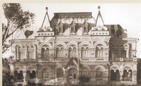
Здание, в котором размещался институт в г. Камышине (1943-1945 гг.)

В тяжелых оборонительных боях Красная Армия отступала. Наступил момент, когда возникла необходимость готовить институт к эвакуации за Волгу. Под непрерывными бомбежками и обстрелами коллектив СГПИ проделал большую работу, готовя институт к эвакуации: было упаковано и перевезено на берег Волги все хозяйственное имущество, оборудование кабинетов и музеев, книги библиотеки. Но 23 августа во время массированной бомбардировки города все это было уничтожено прямыми попаданиями авиабомбы. В те трагические дни были разрушены все три учебных